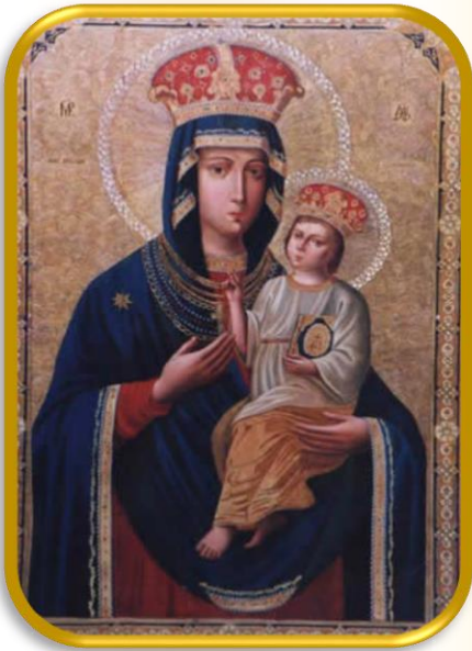
Озерянська ікона Богородиці

Григорій Квітка-Основ'яненко не здобув широкої освіти в навчальних закладах, навчався лише вдома та в школі при монастирі. Мав музичний хист: грав на флейті та фортепіано. Писав духовну музику