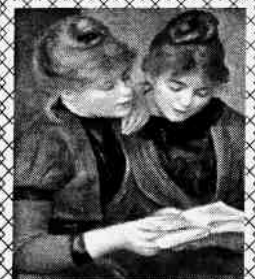
П'єр Огюст Ренуар. Дівчата читають (1889)

Разумеется, не во всех периферийных районах страны дело обстоит так хорошо. Два десятка муниципальных библиотек закрылись в прошлом году, около 300 были