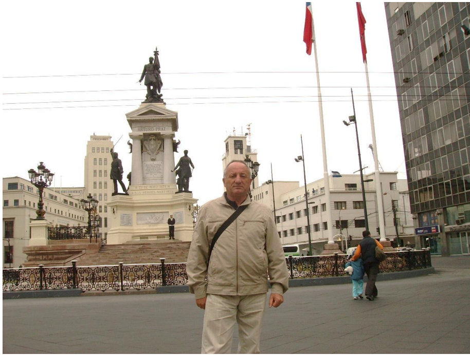
м. Сантьяго (Чилі), 2009 р.