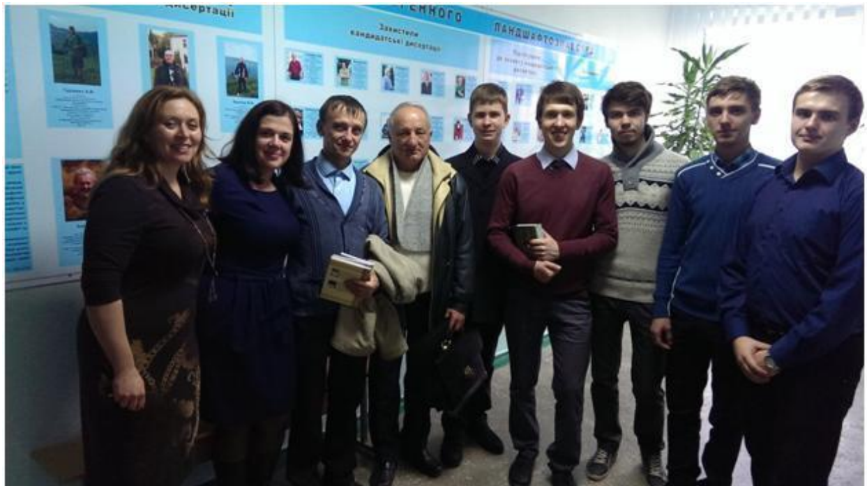
Географічна школа-семінар у Вінниці, 2014 р.