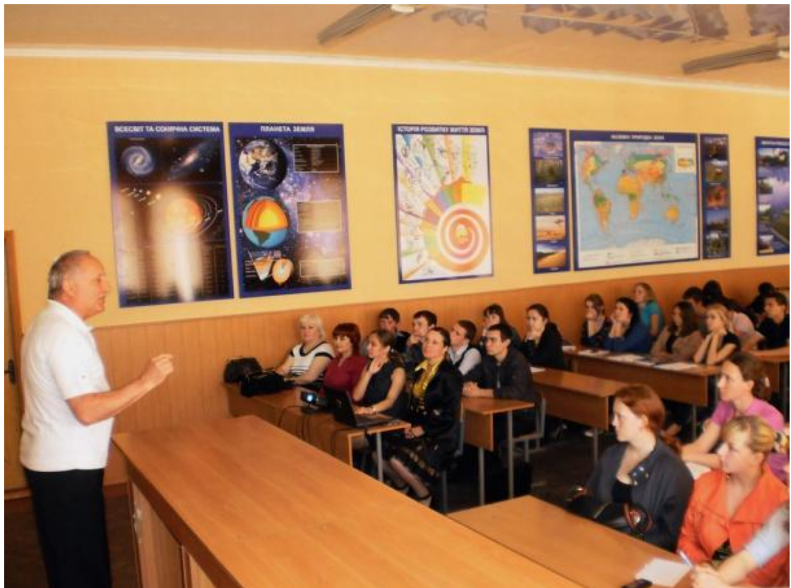
Відкрита лекція провідного географа України, 2013 р.