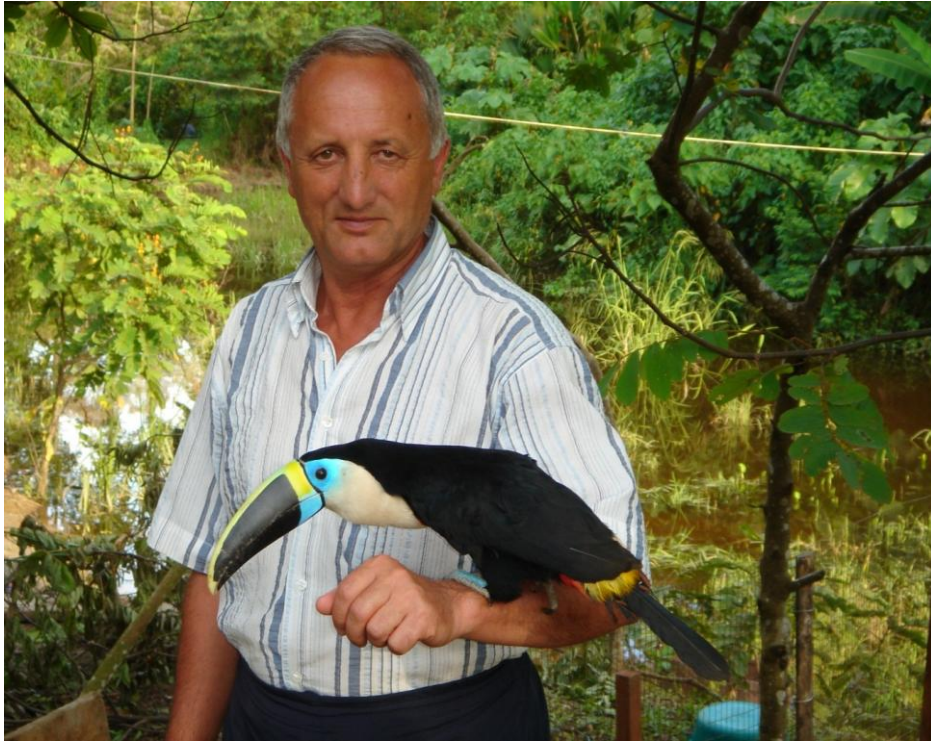
Бразильські джунглі на річці Амазонка, 2006 р.