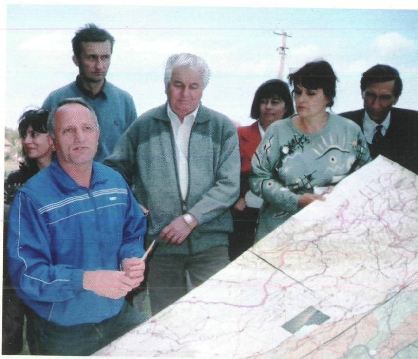
Виїзний польовий семінар Міжнародної конференції з антропогенного ландшафтознавства, с. Медвідка Вінницького р-ну, 2004 р.