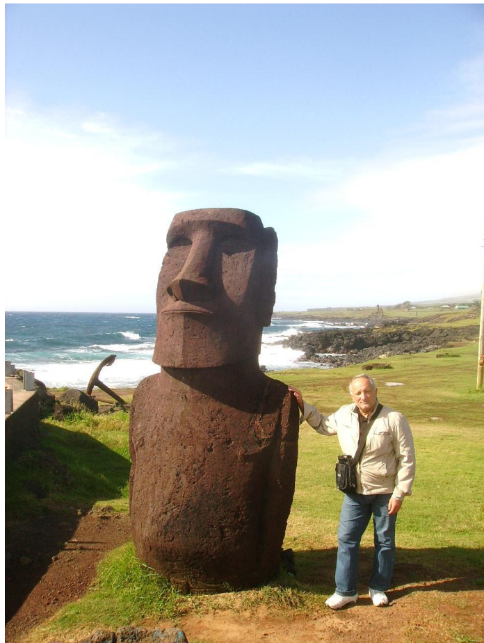
Центр Тихого океану. Острів Пасхи, 2012 р.