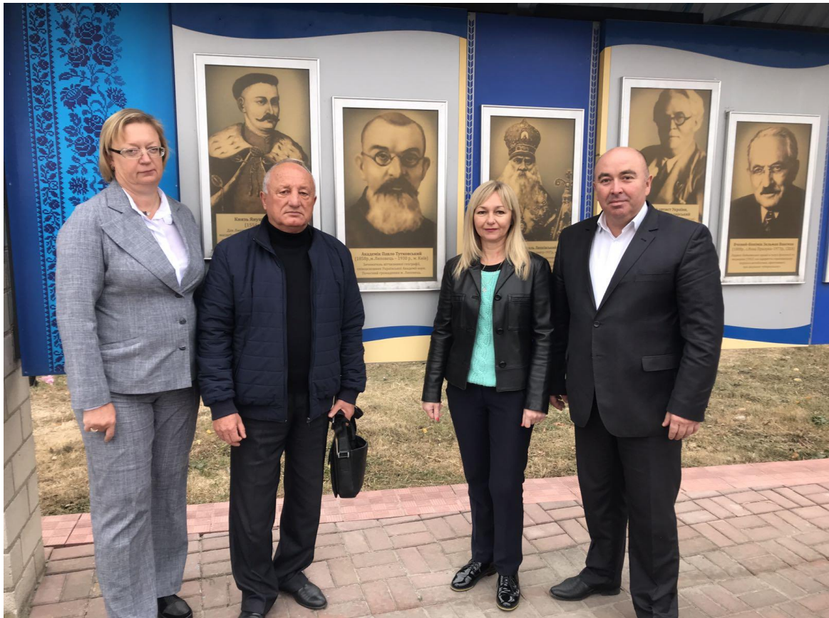
Дружній візит географів у Липовецькому районі, 2019 р.