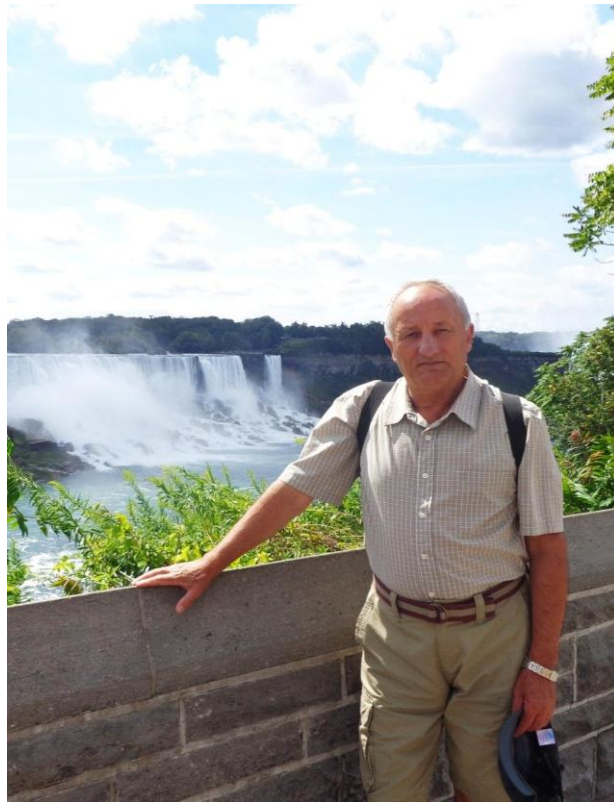
Ніагарський водоспад (Канада), 2011 р.