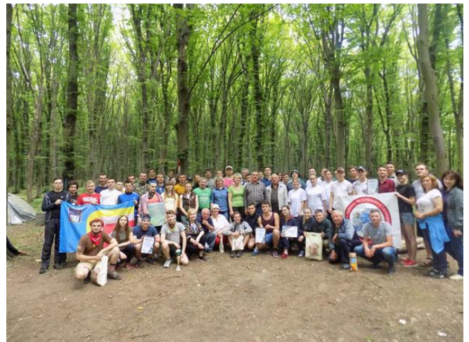
Географічні турніри на кубок заслуженого діяча науки і техніки України, доктора географічних наук, професора Григорія Івановича Денисика (2017, 2018, 2019 рр.)