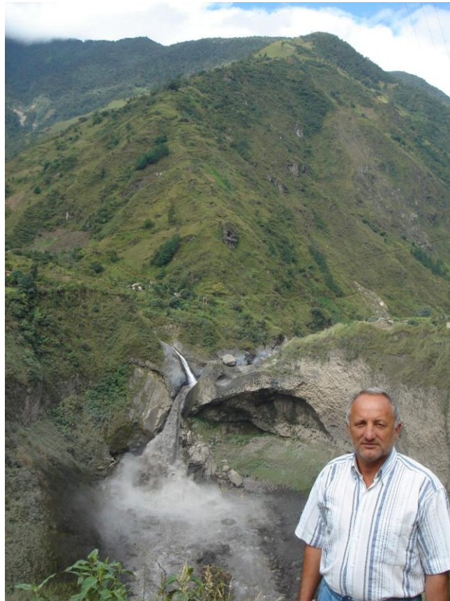
Анди Південної Америки (Еквадор), 2007 р.