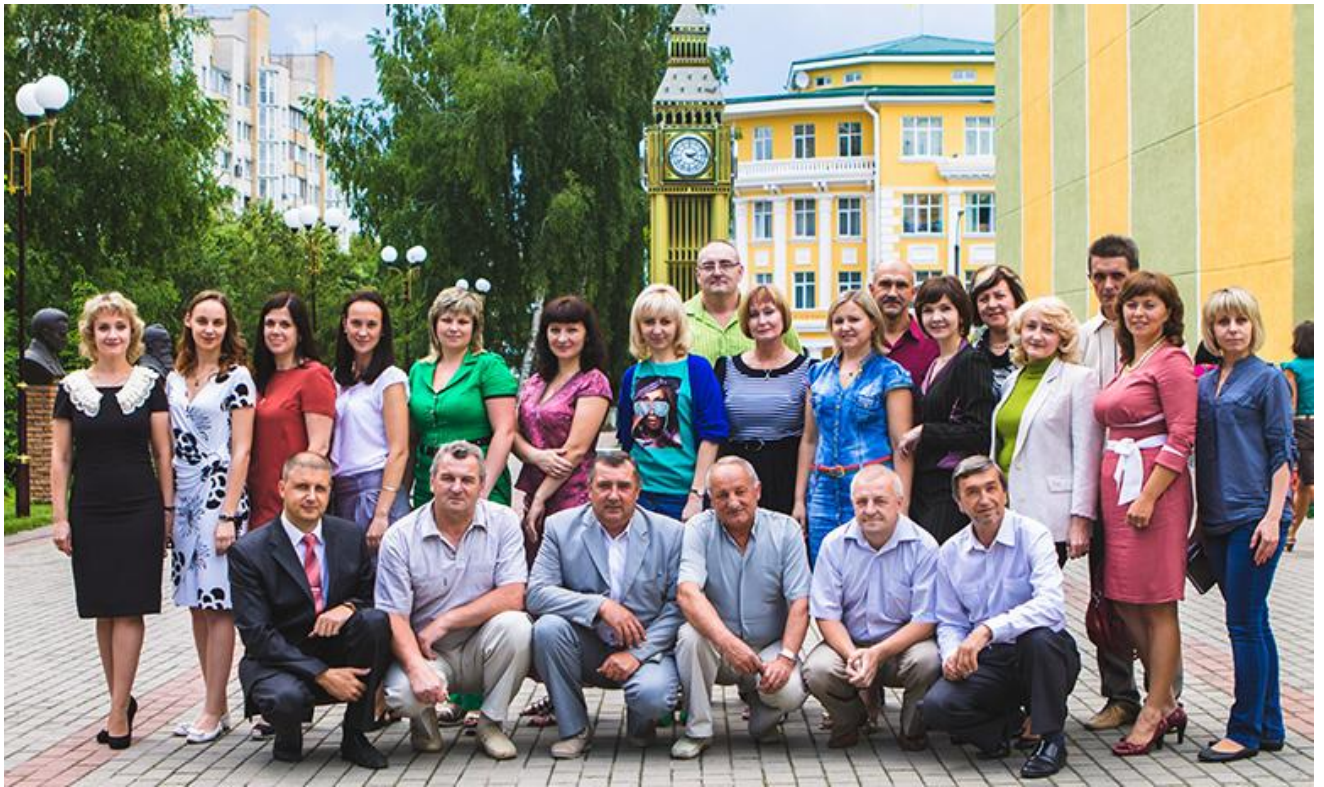
Кафедра географії, 2012 р.