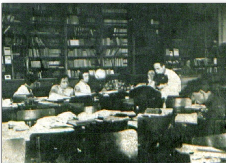
Читальна зала бібліотеки, 1935 р.