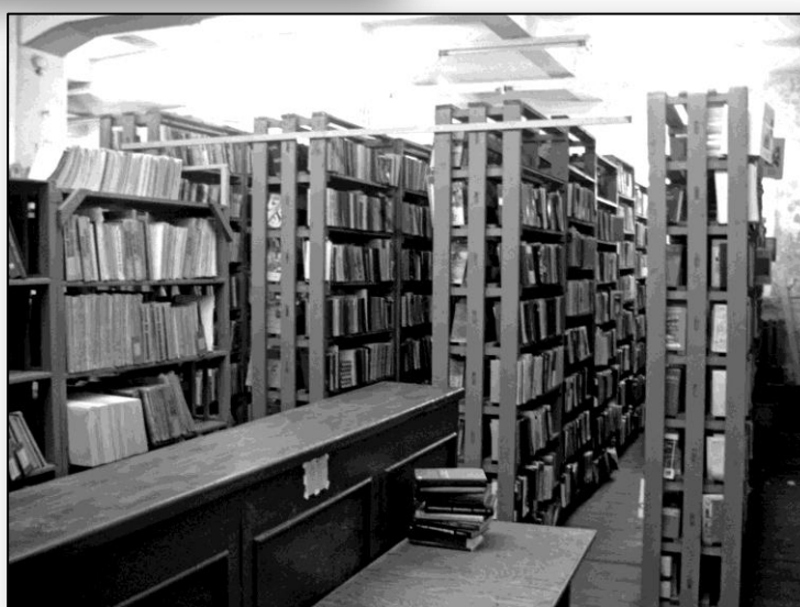
Загальний вигляд книгозберігання, кінець 80-х років XX ст.