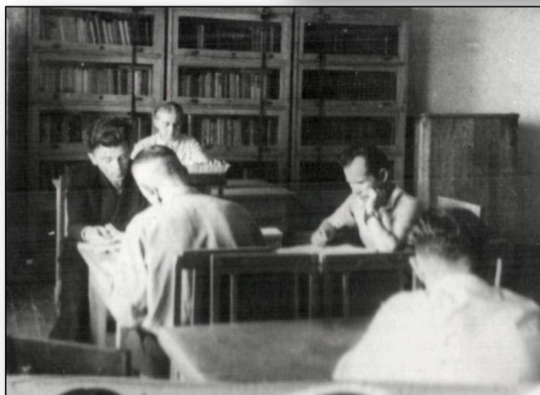
Читальна зала бібліотеки, 1951 р.