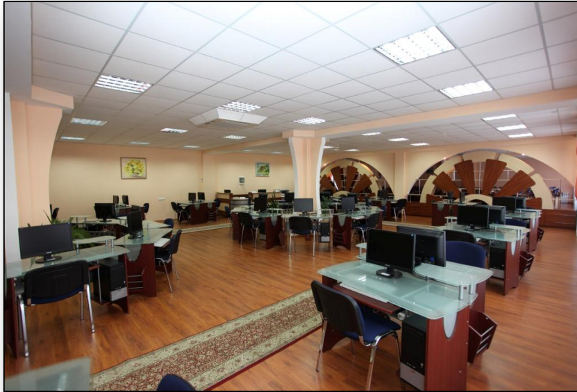
Читальні зали сучасної бібліотеки