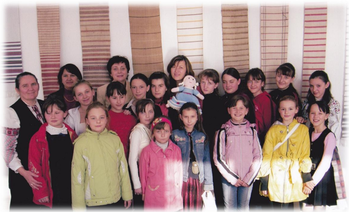
2009 р. Учні та вчителі НВК №2 м. Немирів у навчально-науковій лабораторії Вінницького державного педагогічного університету імені Михайла Коцюбинського