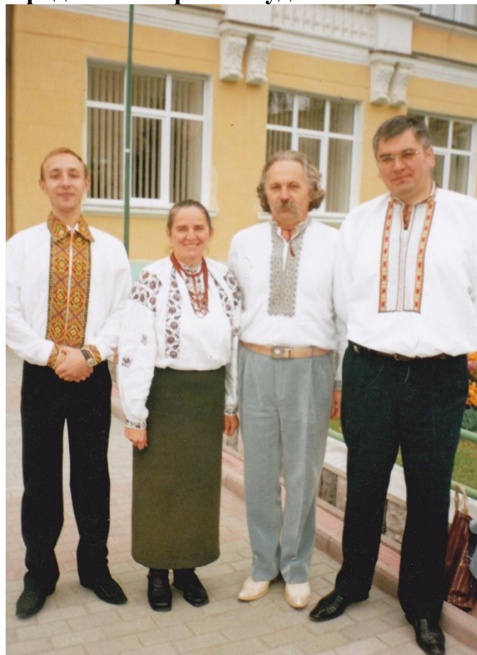
2006 р. Дні народознавства