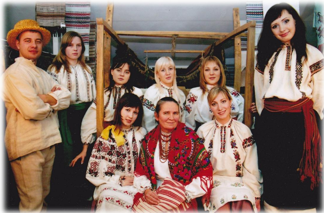
2007 р. У навчально-науковій лабораторії Вінницького державного педагогічного університету імені Михайла Коцюбинського