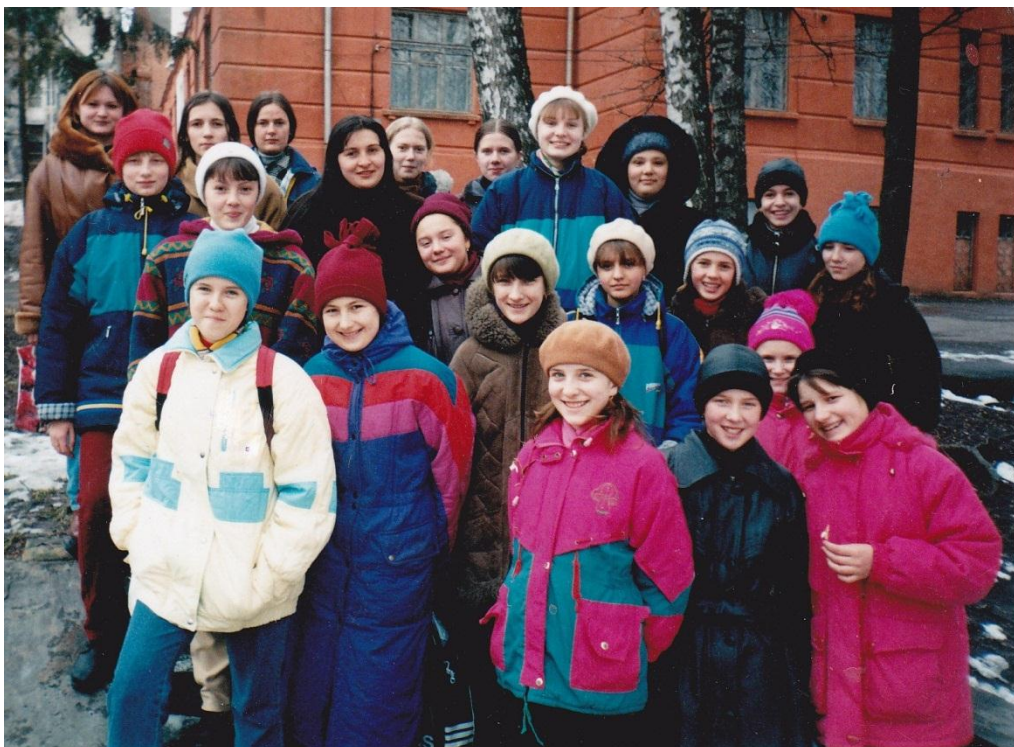
2001 р. Гімназистки та викладачі