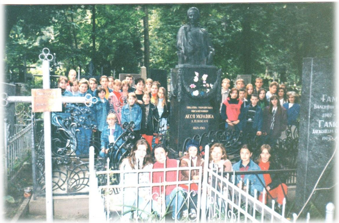
Згори донизу 1998 р., один день з життя гімназії