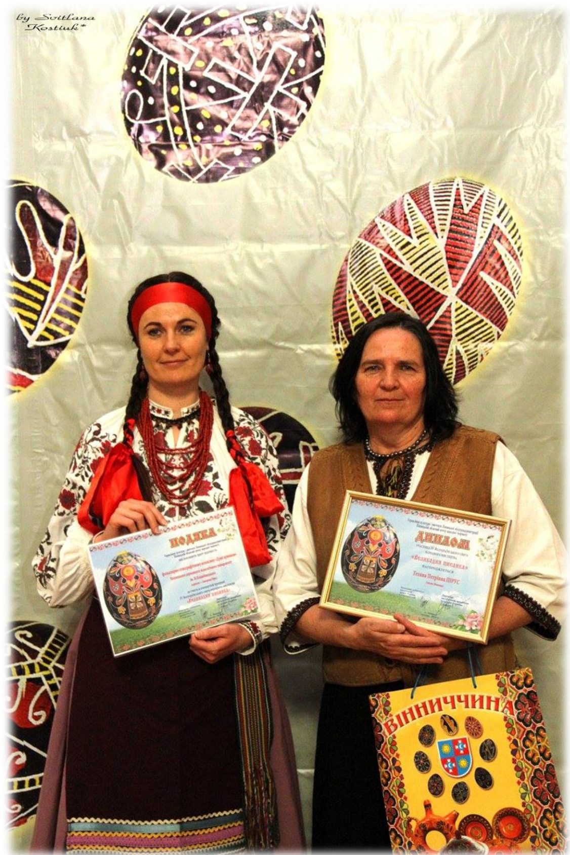
2016 р. м. Вінниця. Всеукраїнське свято народного мистецтва «Великодня писанка». Почесні нагороди