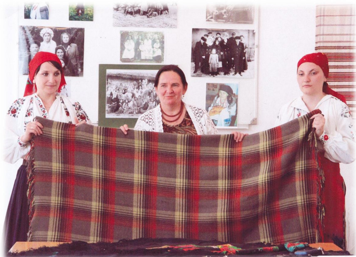
2012 р. Відкриття виставки «Хустино моя терновая»