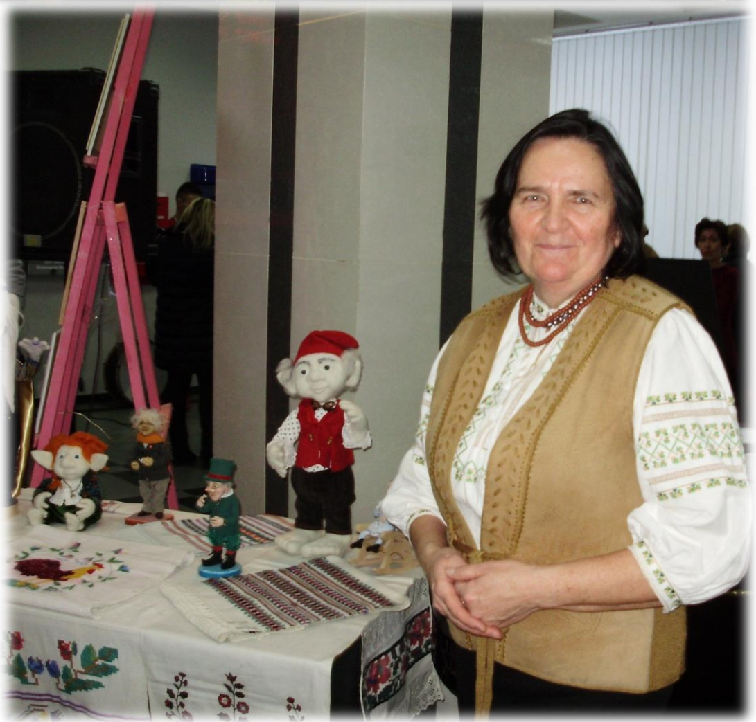
2017 р. Участь у міських заходах