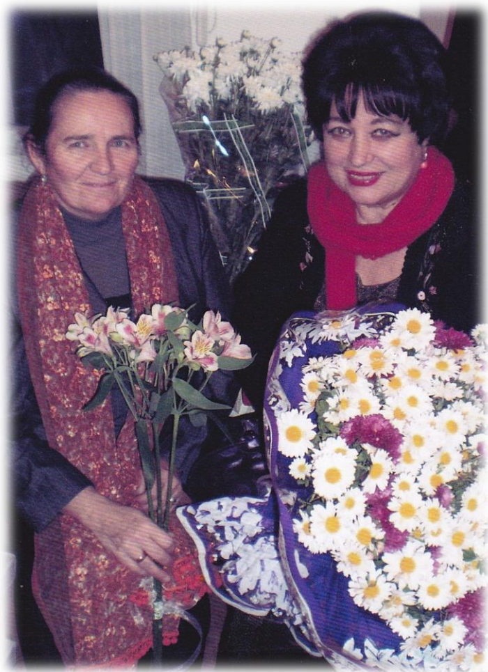
2011 р. Заслужений журналіст України Ганна Секрет