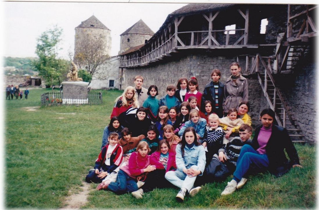
Згори донизу 2002 р., гімназистки на святі «Великодня писанка» у ВДПУ