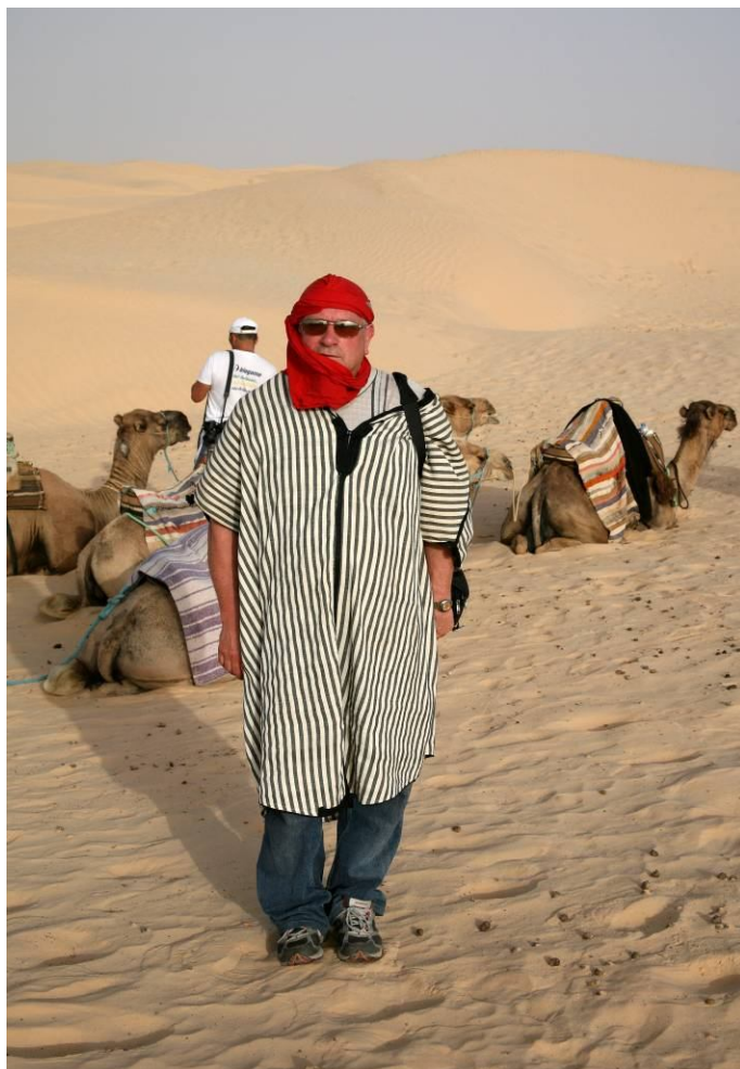
Алжир. Під сонцем Сахари