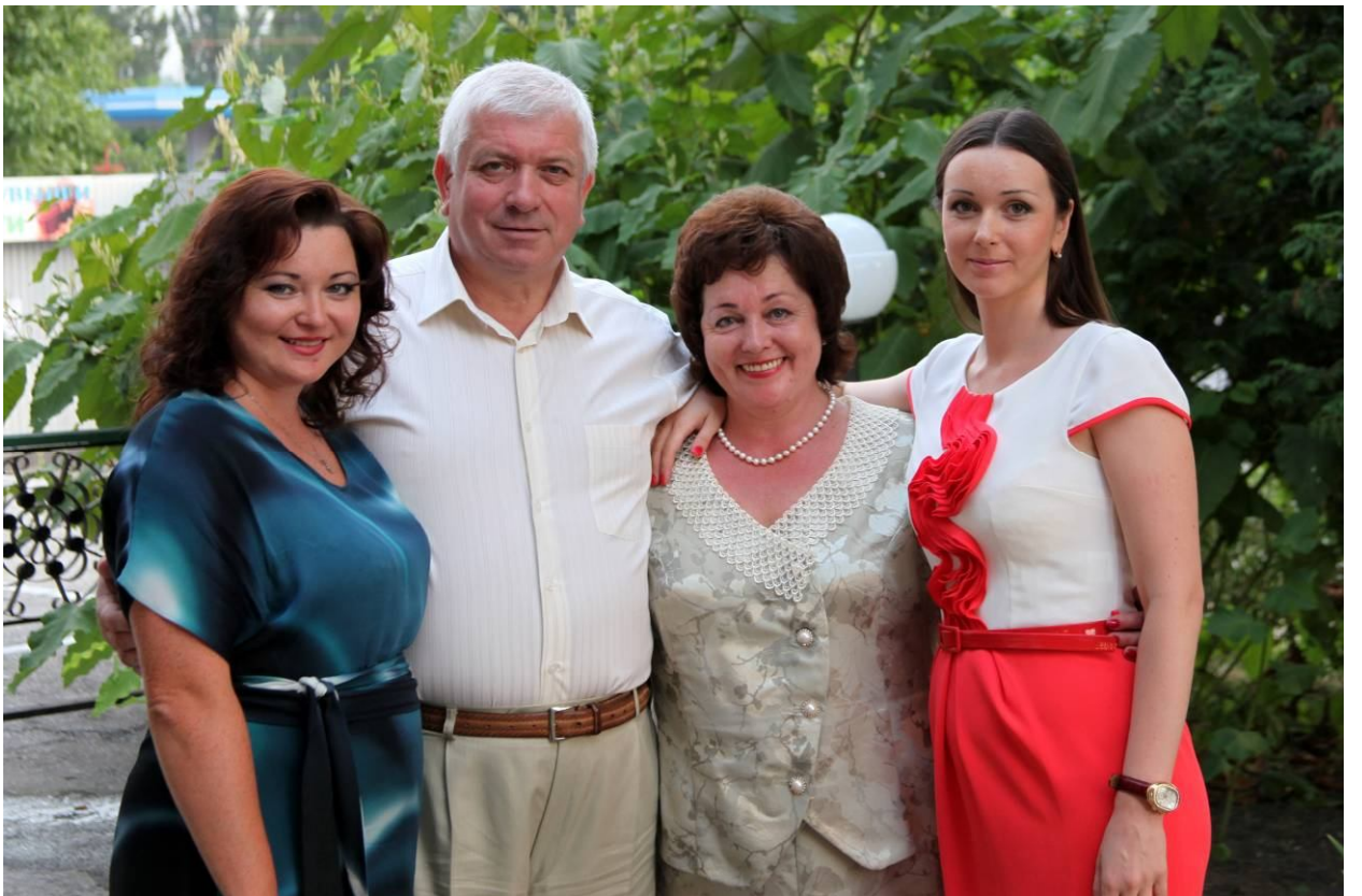
У колі сім'ї