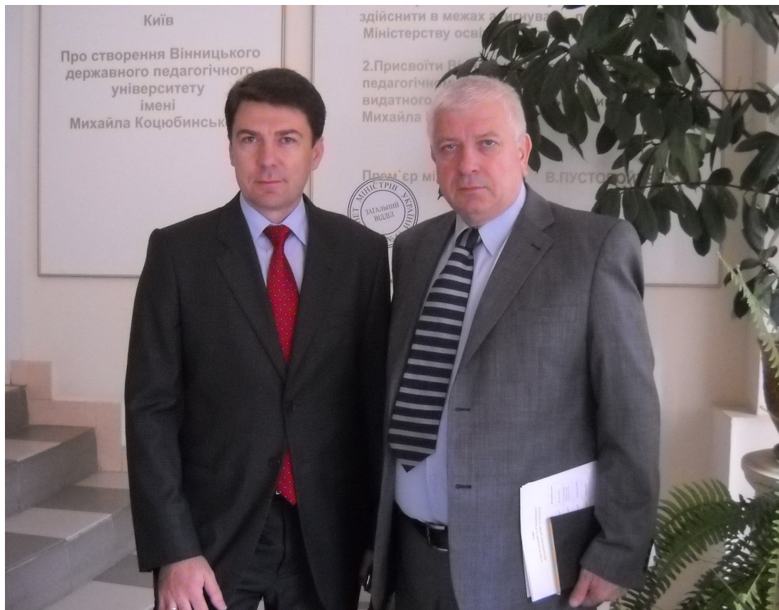
З першим заступником міністра освіти і науки, молоді та спорту України Є. М. Сулімою