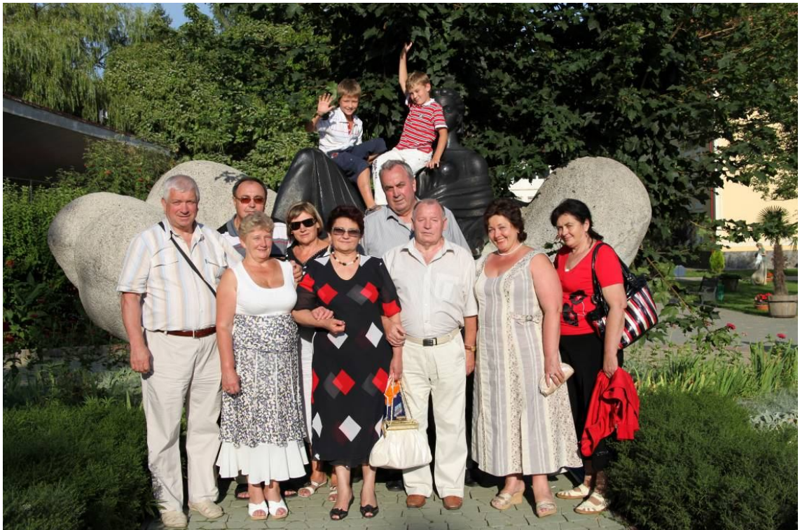
З рідними та друзями