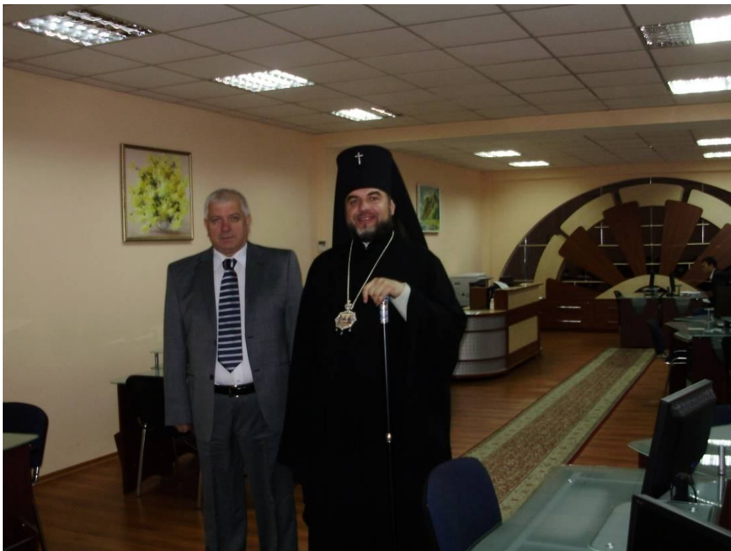
В електронній залі університетської бібліотеки з архієпископом Вінницьким і Могилів-Подільським Симеоном