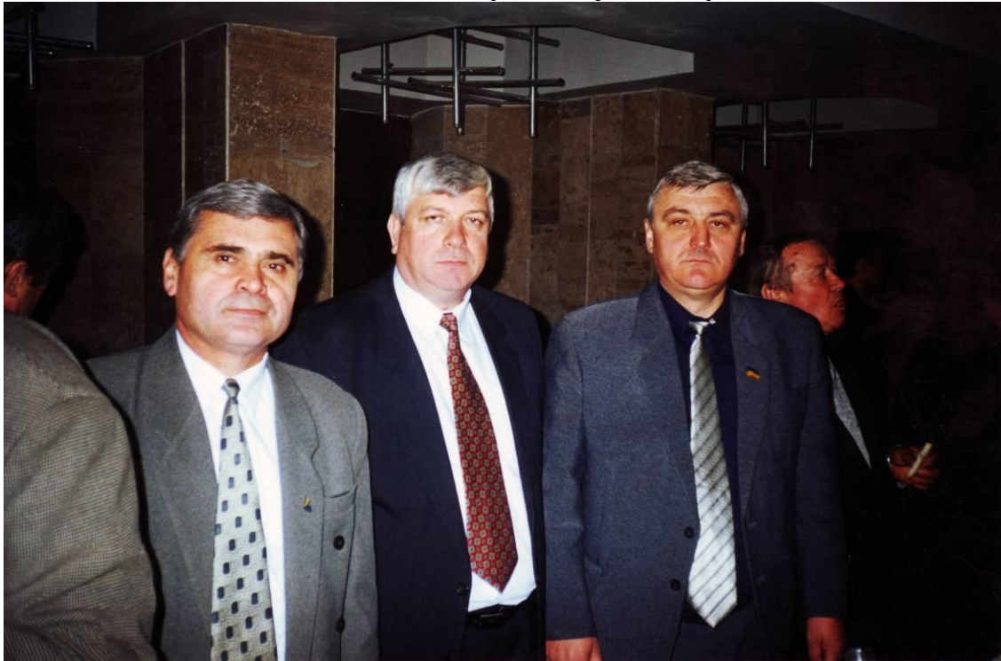
З заступником голови Вінницької облради С. С. Нешиком