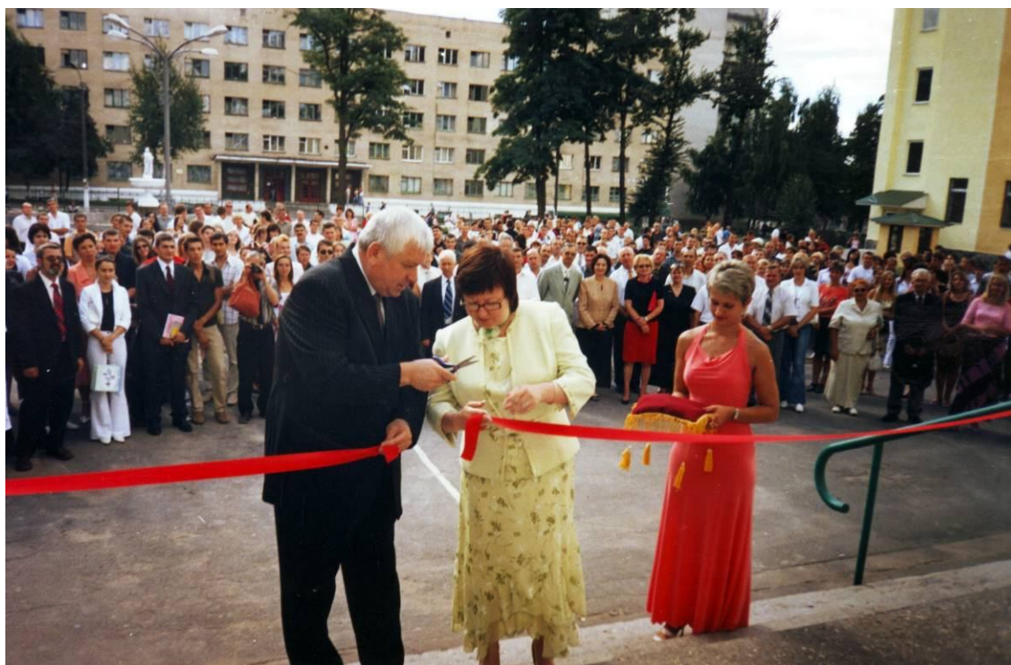
Презентація оновленого корпусу № 3