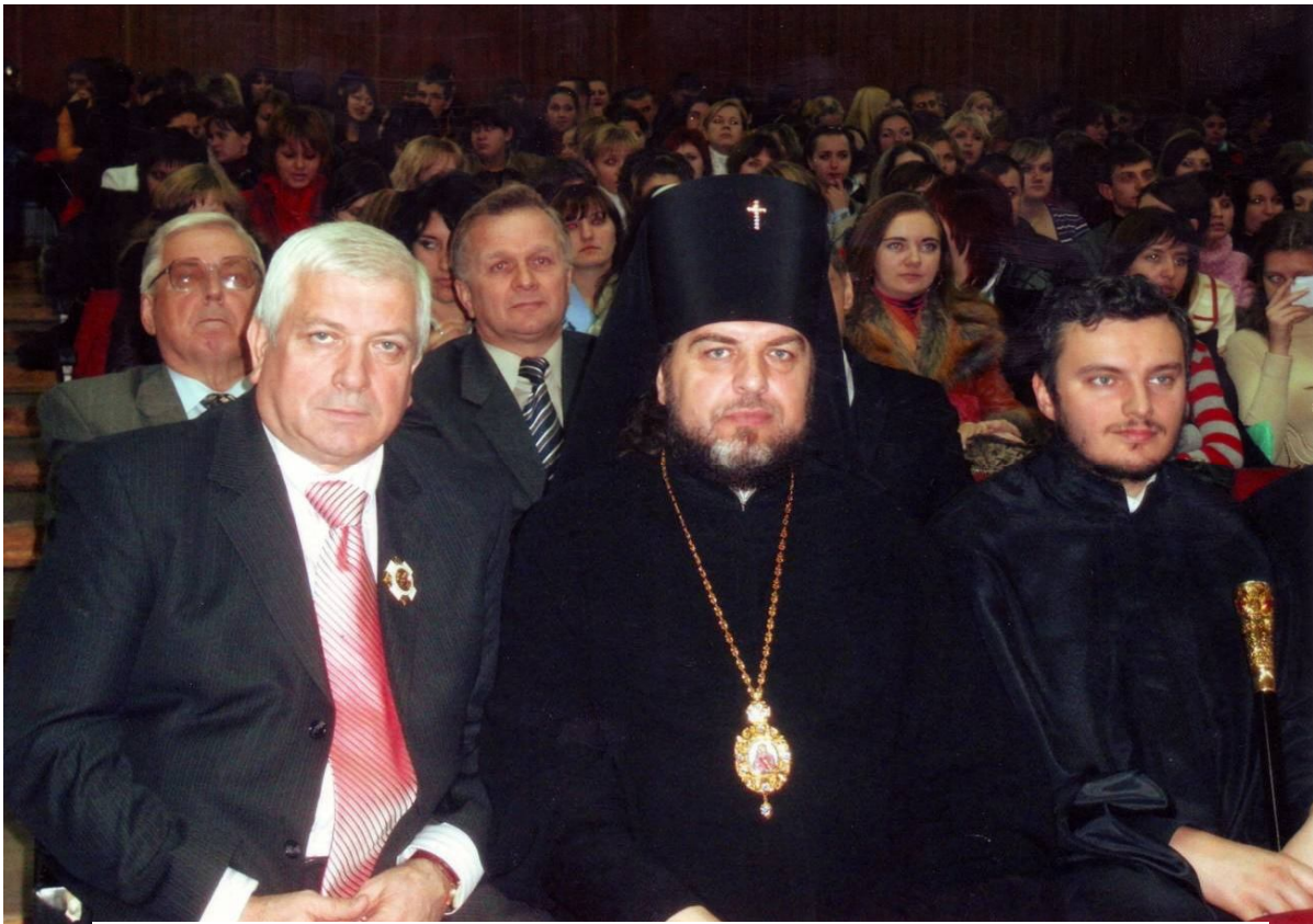
З Архієпископом Вінницьким та Могилів-Подільським Симеоном