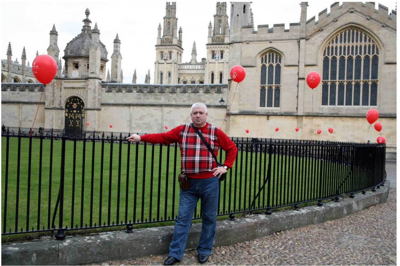
Перед Оксфордським університетом