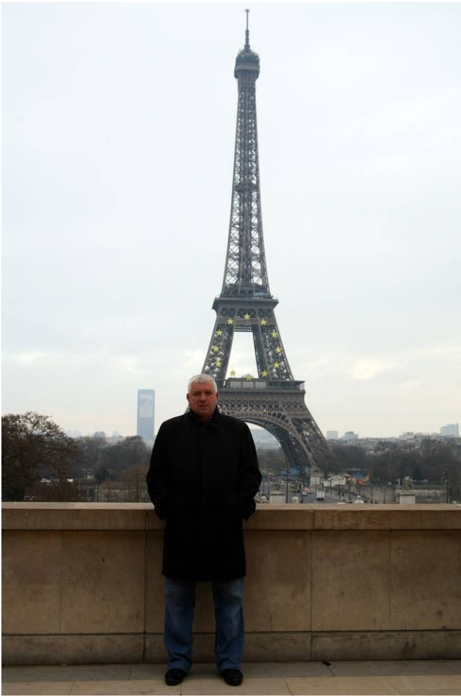
Визначними місцями Парижа