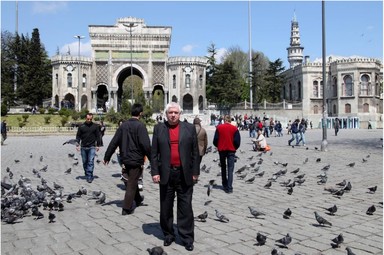
На площі перед Стамбульським університетом