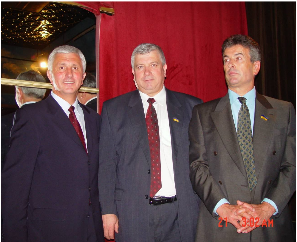
З депутатами Верховної Ради А. С. Матвієнком та В. В. Онопенком