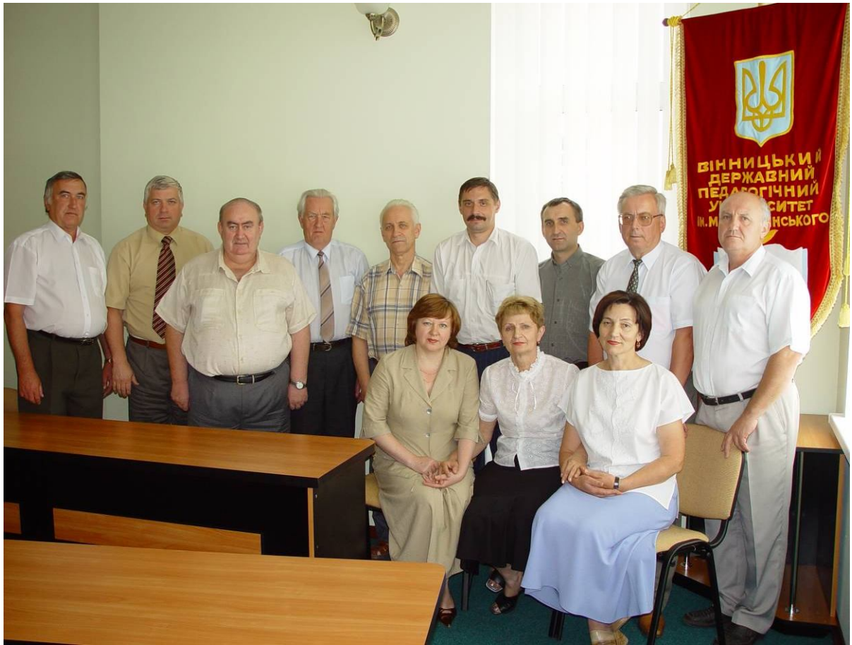
Керівний склад ВДПУ ім. М. Коцюбинського, 2003 р.