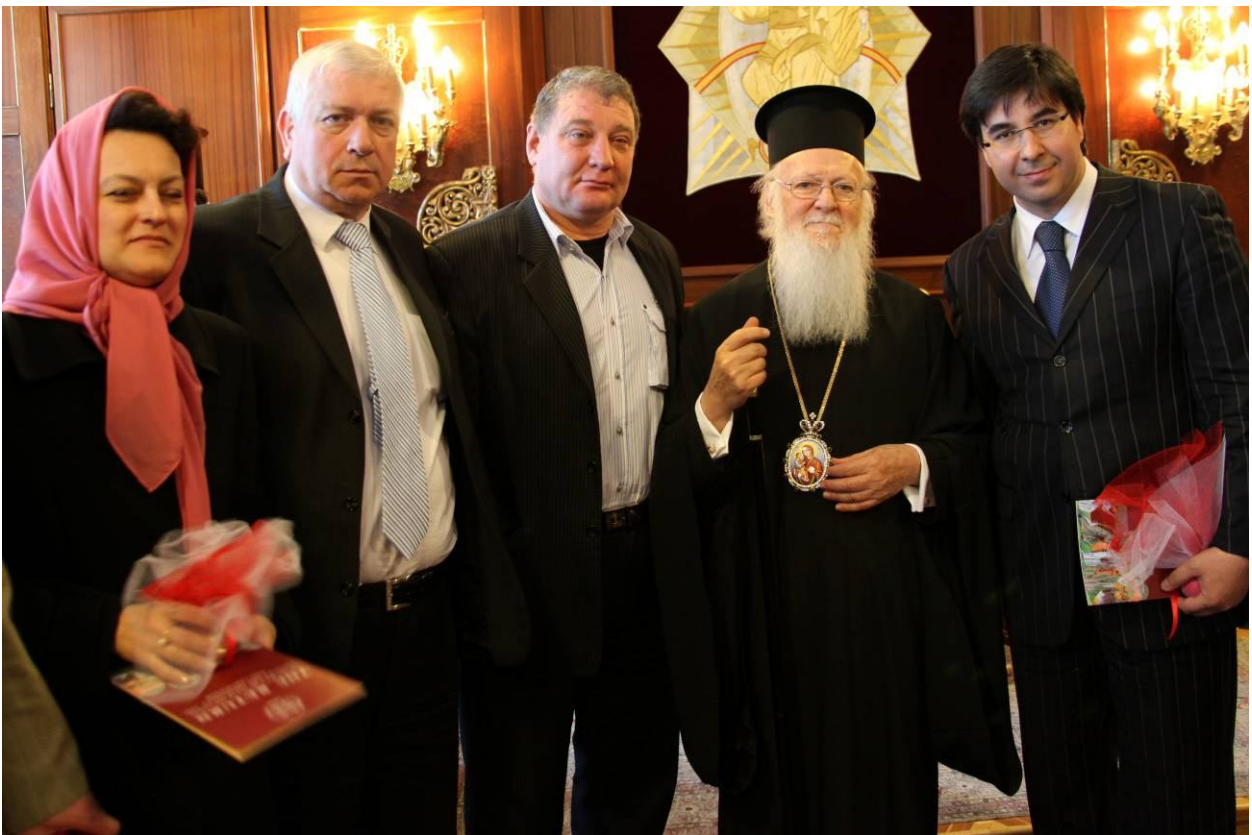
Туреччина. Прийом у резиденції Вселенського патріарха Варфоломія