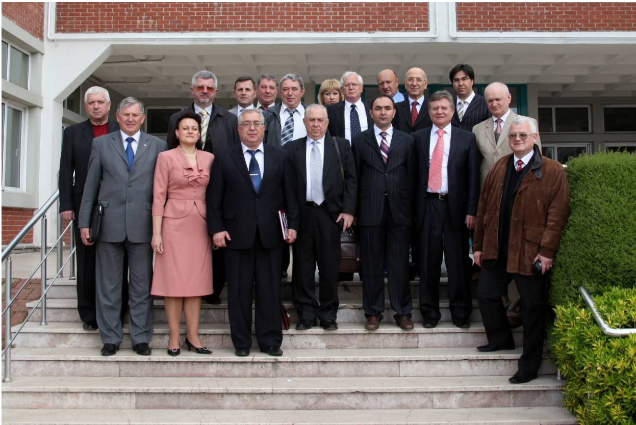
З колегами-ректорами на конференції в Стамбулі