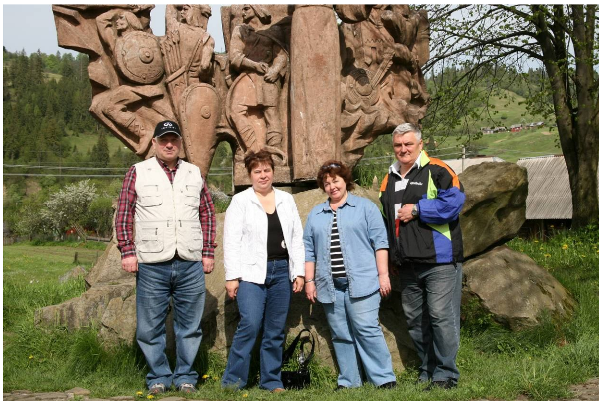
На відпочинку в Карпатах