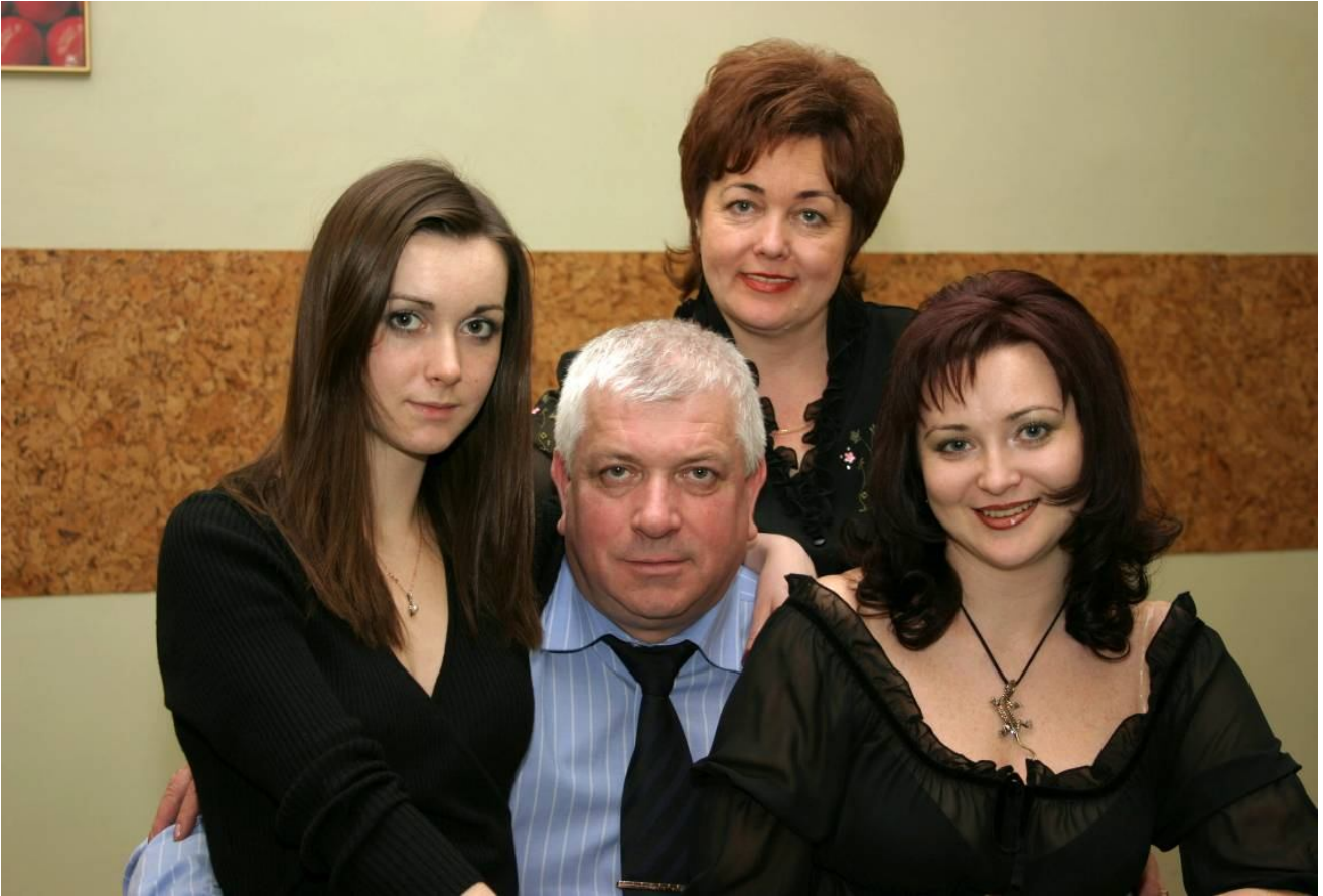
Найрідніші у світі жінки