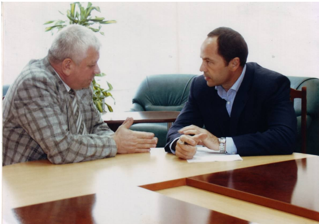
Ділова розмова з С. Л. Тігіпком