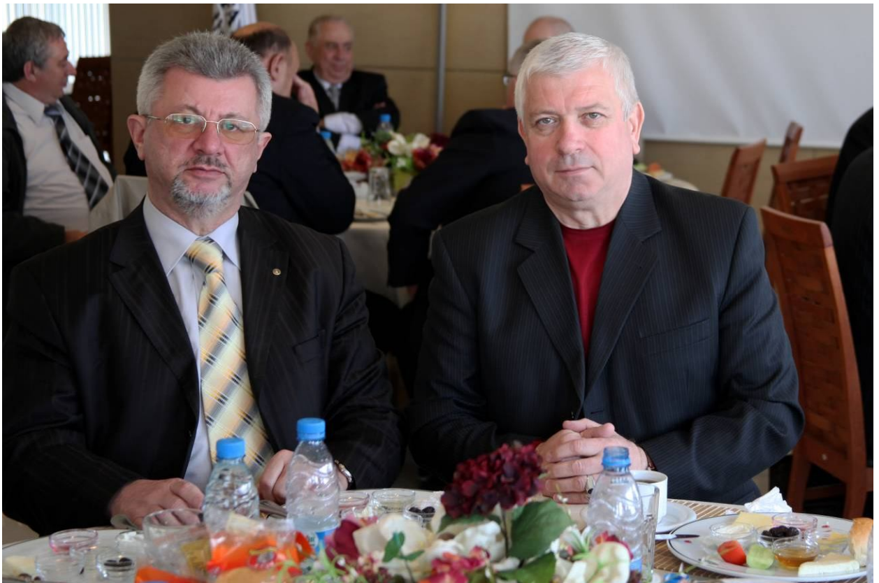
З ректором Ялтинського гуманітарного педуніверситету, членкором АПН України О. В. Глузманом