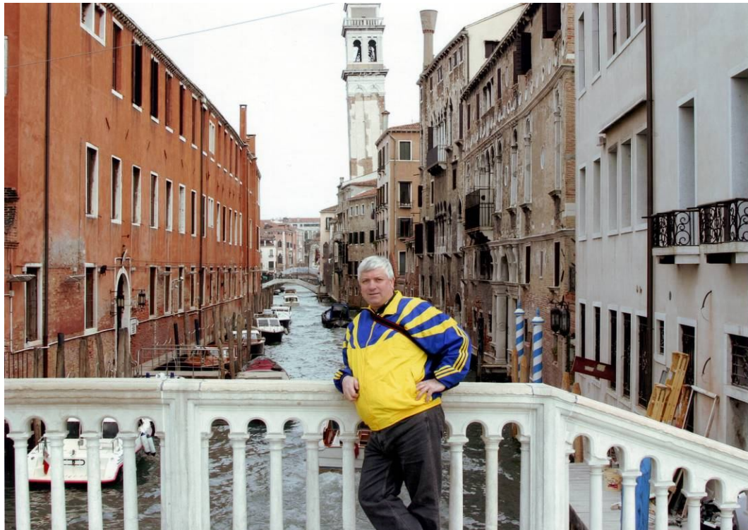
У романтичній Венеції