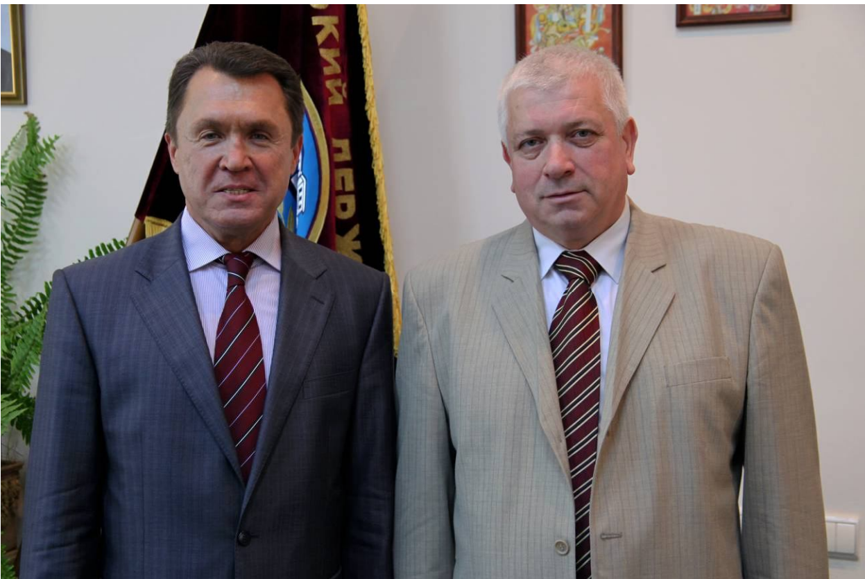
З віце-прем'єр-міністром України, академіком В. П. Семиноженком