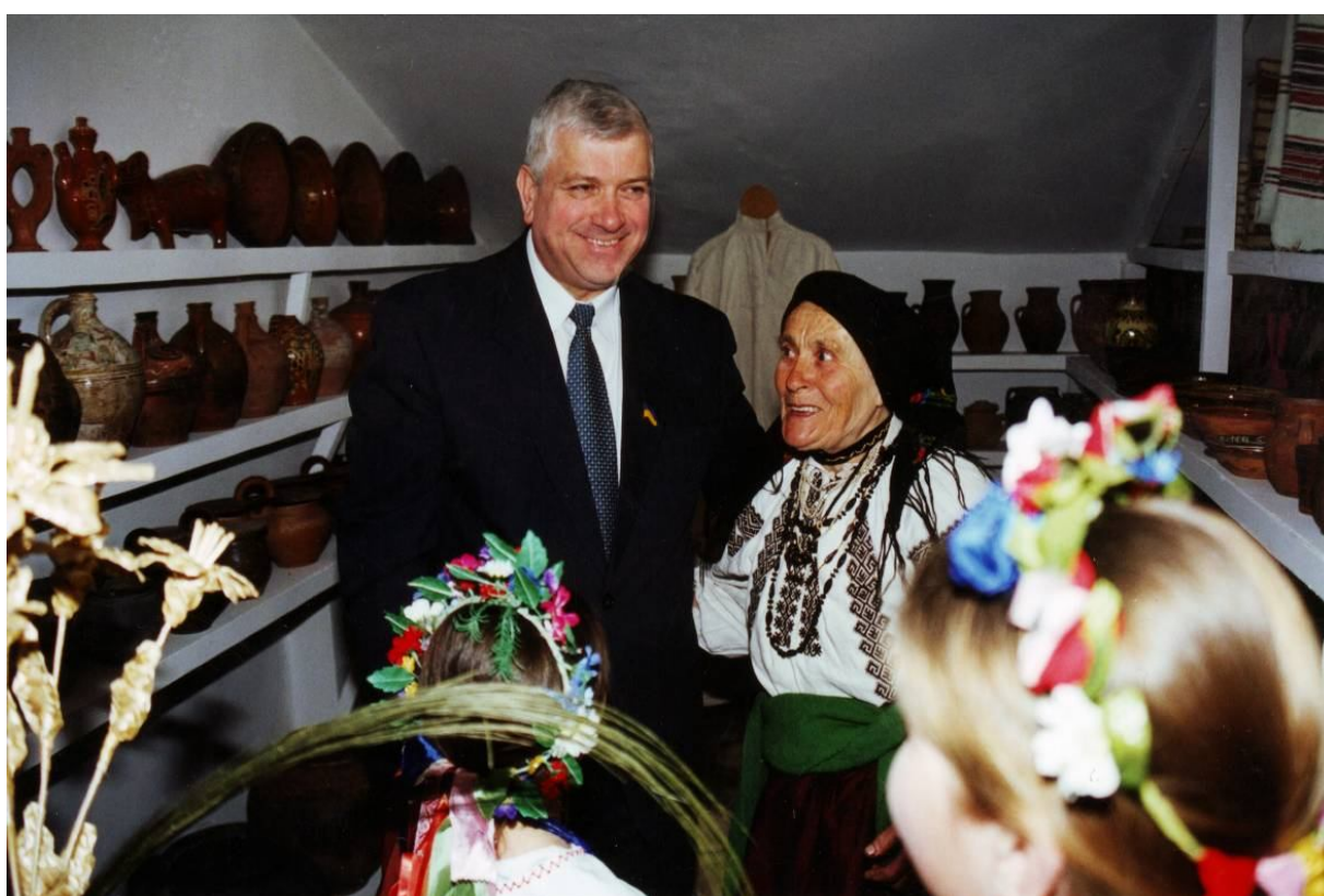
Презентація оновлених приміщень в народознавчому центрі