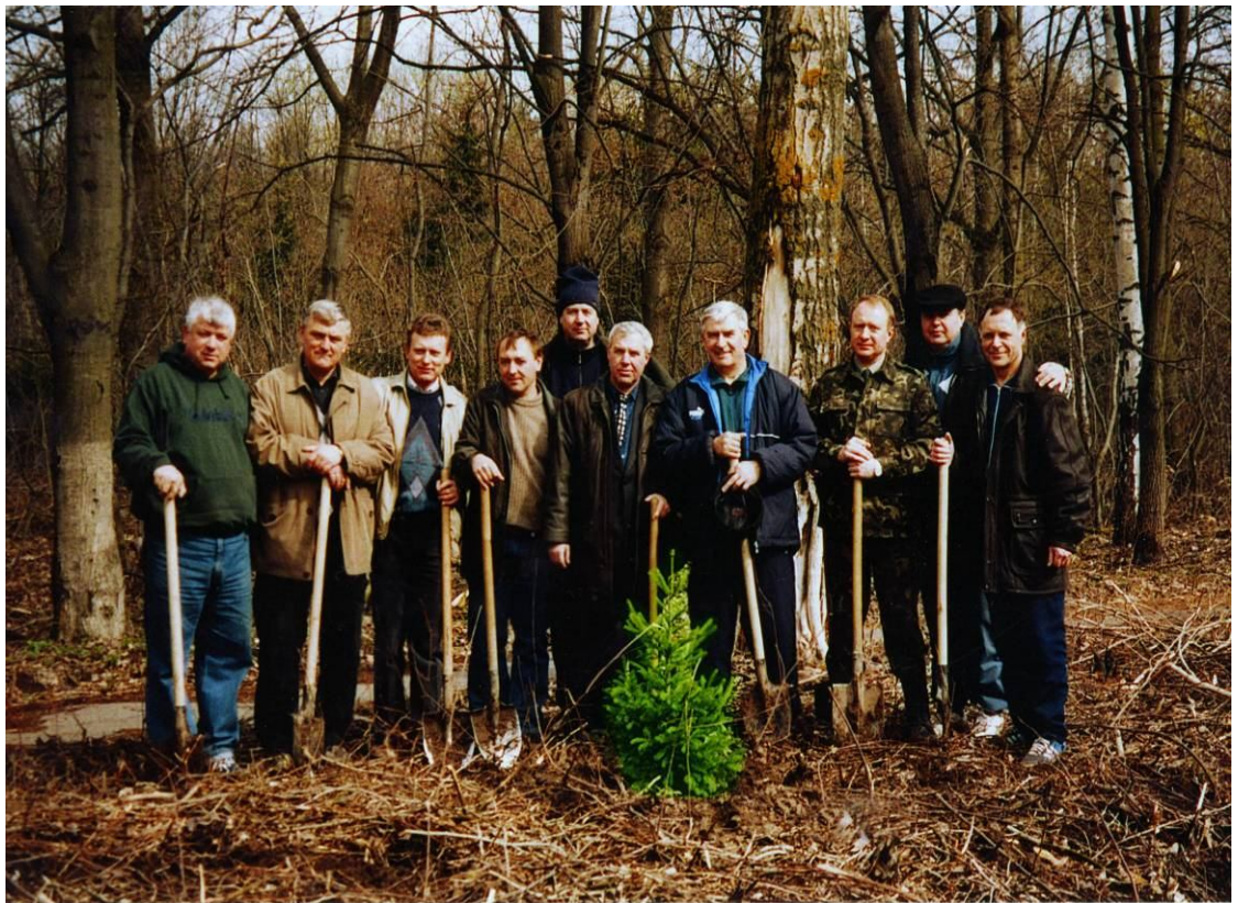
На Великодньому суботнику з керівництвом Вінницької області 14 квітня Першого року Третього тисячоліття