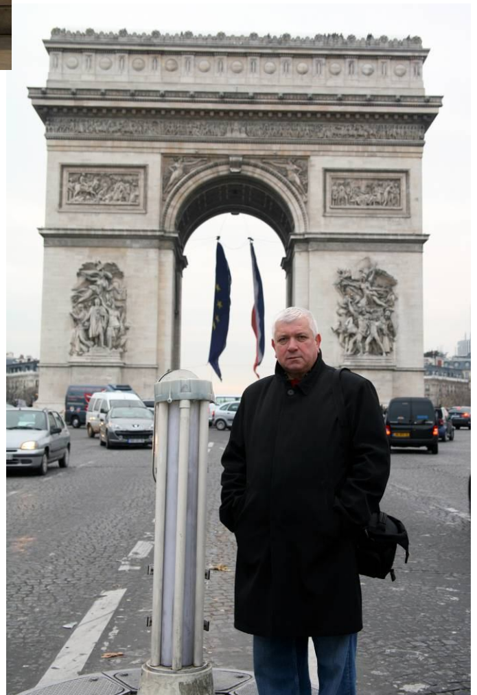
Біля Тріумфальної арки