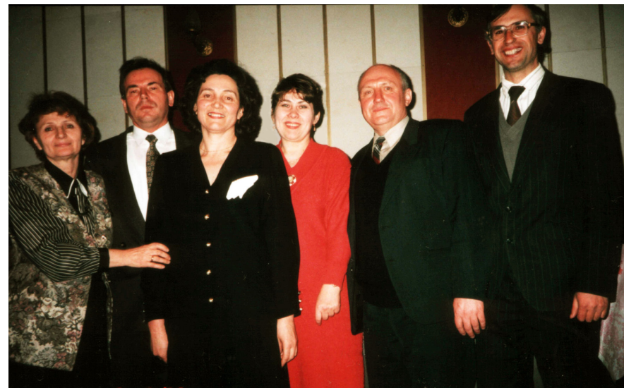
З деканами факультетів (1997)