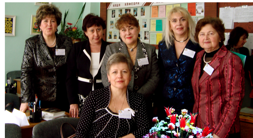
Науково-практична конференція з проблем наступності дошкільної і початкової освіти (2009)