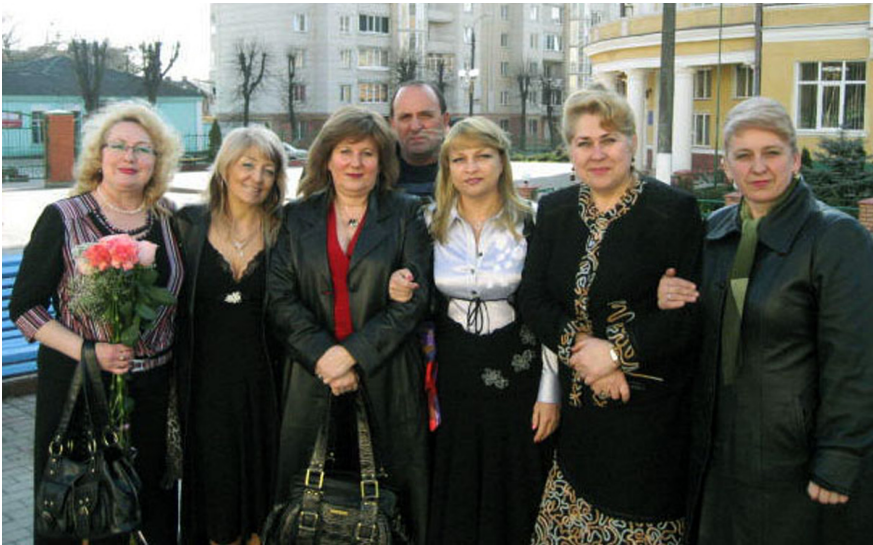
Зустріч з одногрупниками (випуск 1978 року)