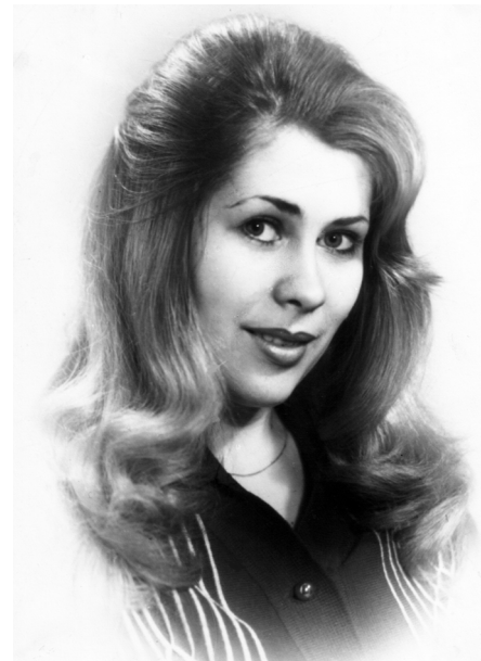
Студентка музично-педагогічного факультету ВДПІ ім. М. Островського