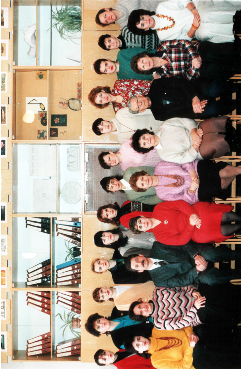
Кафедра ПМПН (1997)