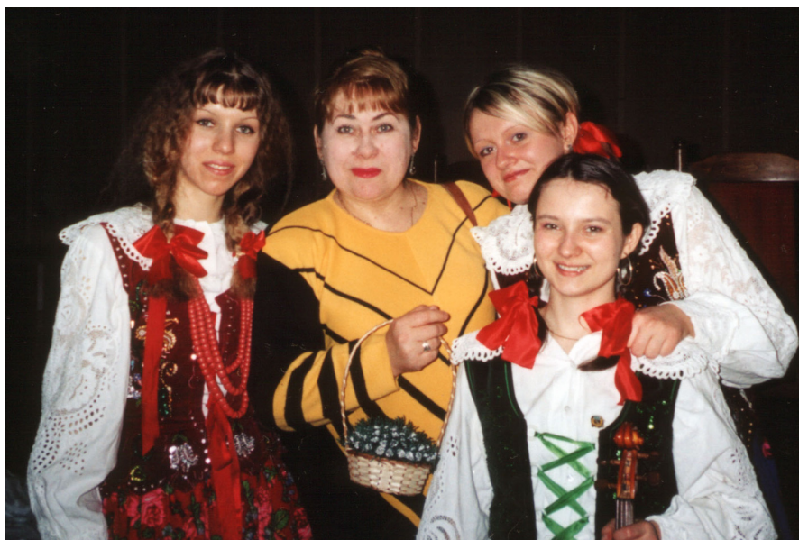
З польськими студентами (м. Ченстохова, 2004)