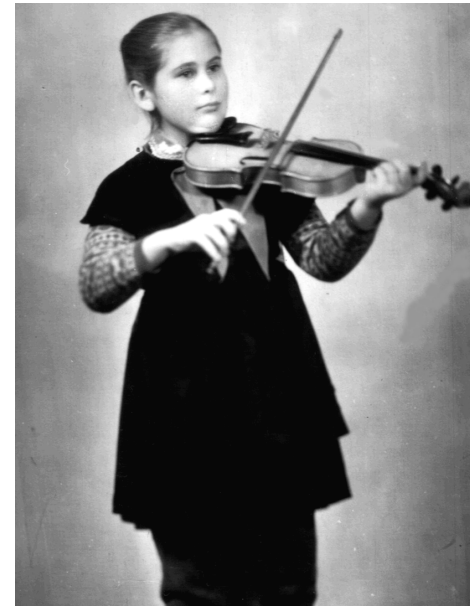
Учениця ДМШ № 1 м. Вінниці (клас Шестуна Ю. І.)