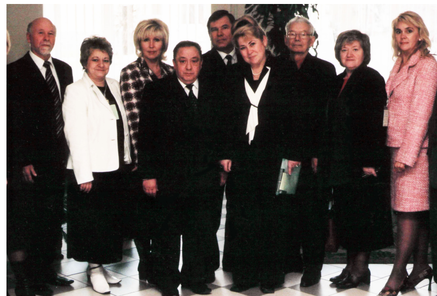
З учасниками науково-практичної конференції (2007)