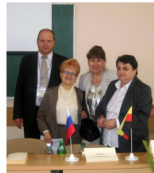
Міжнародна наукова конференція (2010)