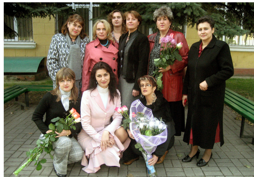
День учителя (2009)