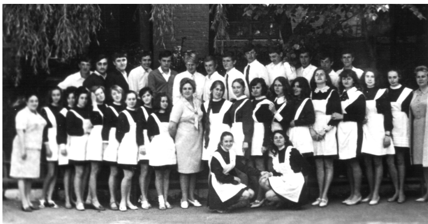
Серед учнів 10-А класу (перша праворуч від класного керівника)

и группах продлённого дня. — К. : НИИ педагогики УРСР, 1983. — С. 64-67.