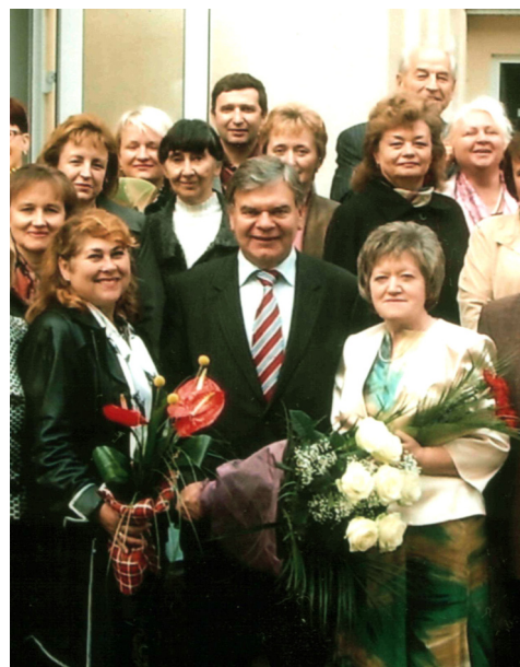
На святі в АПН України (2008)

У 2009 році налагодила зв'язки з освітянами Румунії. Зокрема опублікувала статтю у збірці університету Альба Юлії до 1-ої Міжнародної Конференції з лінгвістичної та інтеркультурної освіти з проблем оновлення підходів до виховання в контексті культурологічної парадигми освіти.