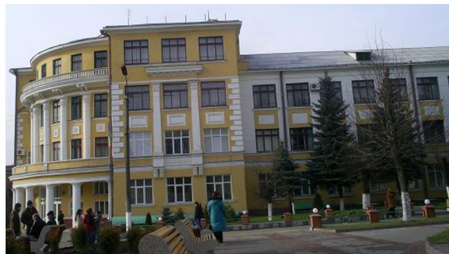
Вінницький державний педагогічний університет імені Михайла Коцюбинського