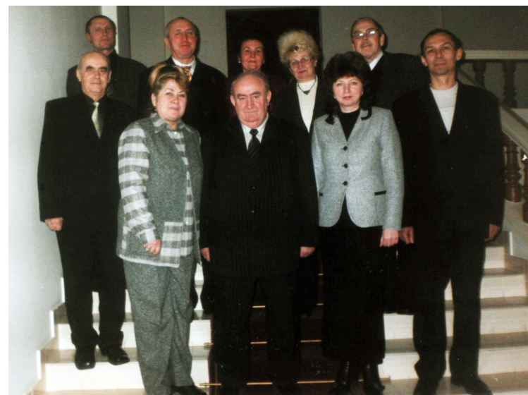
У складі спеціалізованої вченої ради ВДПУ ім. Коцюбинського (заступник голови ради)