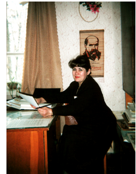
Перший рік роботи на посаді завідувачки кафедри ПМПН (1996)