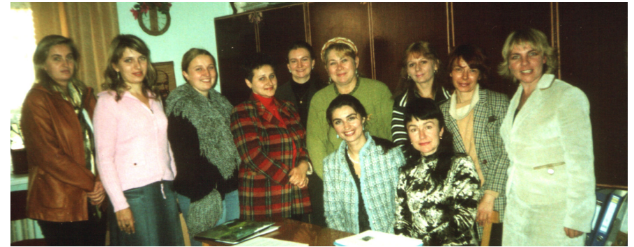
Методологічний семінар аспірантів і здобувачів