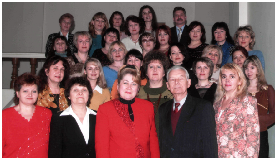
Кафедра ПМПН (2006)