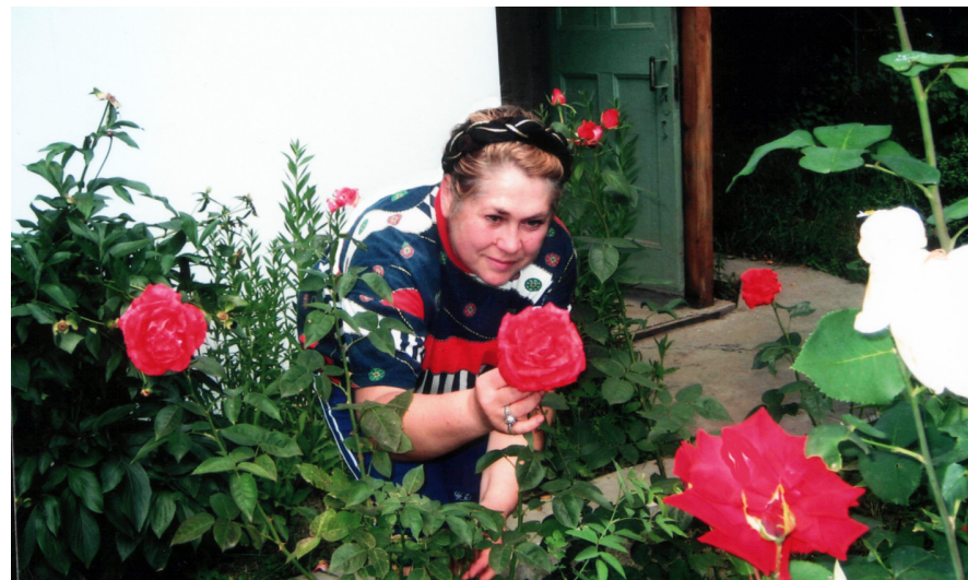
Розмова з трояндами