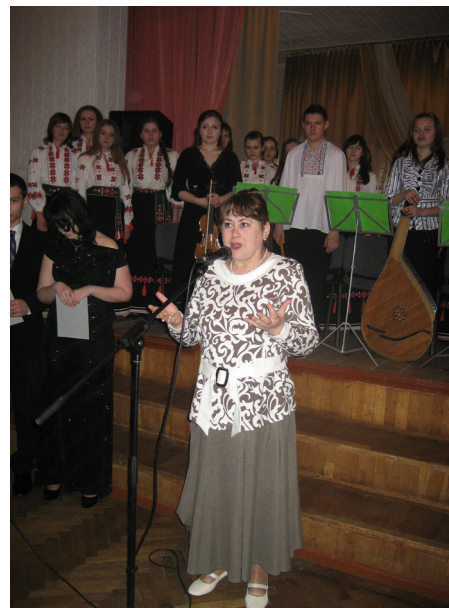
Виступ під час акредитації Луцького педагогічного коледжу (2010)